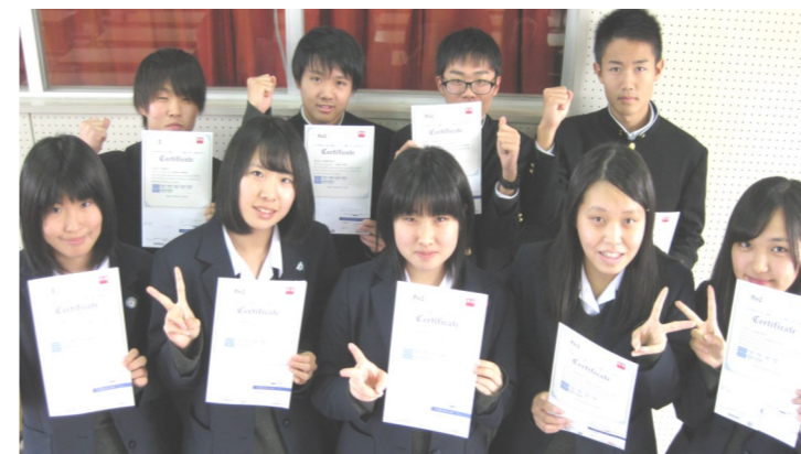
↑第2回英検合格者たち！ 合格した生徒は「在学中に準1級も狙います！」と気合十分！

岩ヶ崎高校英語科では、大学入試に有利なGTEC (全員対象) や英検といった外部試験の積極的な受験を推奨しています。定期的に受験するため、どれだけ英語力がついたか実感できます！さらに自分の英語力を客観的に評価され資格を得ることも大きな励みとなります！