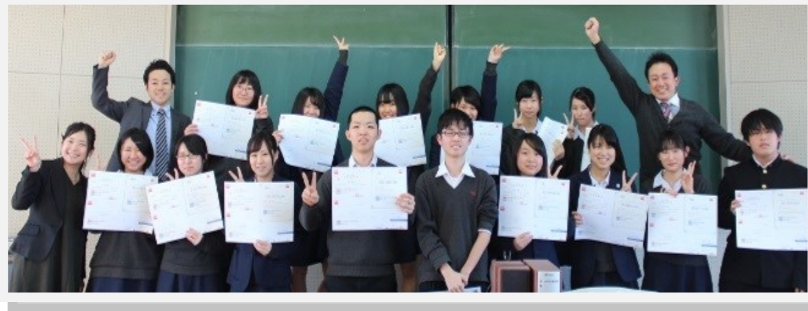
昨年度英検 第3回目合格者 たち。 よく頑張りました！

岩ヶ崎高校英語科では、大学入試に有利なGTEC（全員対象）や英検といった外部試験の積極的な受験を推奨しています。特に英検は4技能（読む、聞く、書く、話す）の技能を評価することができるので、自分がどれだけ英語が「できる（使える）」のかを試すことができるので、合格すると大きな自信になります。