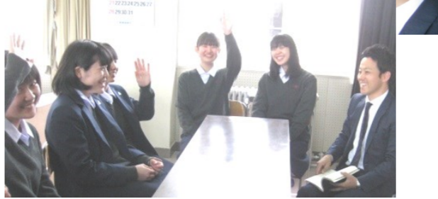
みんな楽しみながら、着実に英語力を上げているようです。1年生全員のこれからの成長が楽しみです。